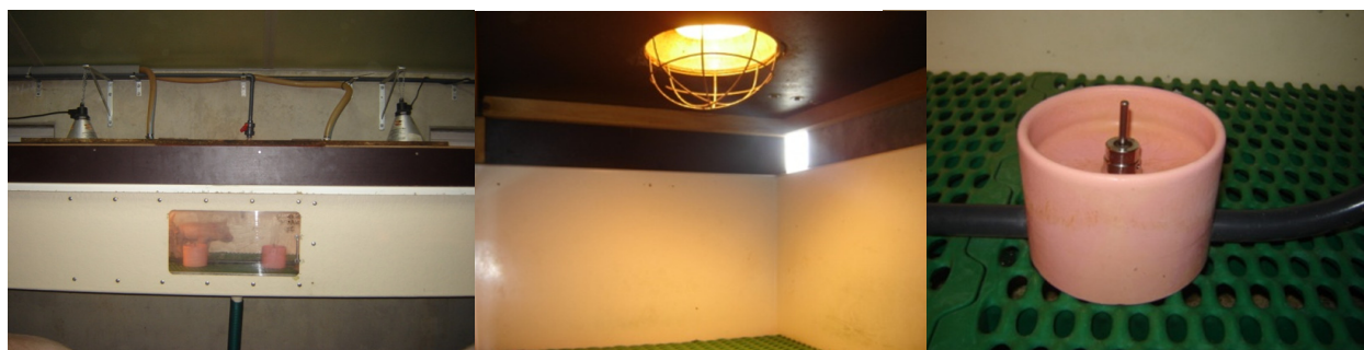
Figuur 1. Uitzicht en opbouw rescuedeck

Indien de gegevens uit de volledige kraamstalperiode samen worden bekeken, is er geen verschil te zien tussen de 3 groepen. Wanneer van naderbij wordt gekeken, wordt duidelijk dat tijdens de eerste 2 levensweken de groepen gelijk groeien, echter in de 3e en 4e levensweek lopen de biggen uit de rescue deck uit op de andere biggen. Een mogelijke verklaring hiervoor kan worden gevonden in het feit dat de biggen bij de moederzeug of de pleegzeug in hun melkopname worden beperkt door de melkproductie van de zeug, terwijl de biggen in de rescue deck ad libitum melk ter beschikking hebben in de rescuecups (melkdispensers). De voeder/melkbehoefte van de biggen stijgt immers naarmate ze ouder en zwaarder worden, terwijl de melkproductie van de zeug niet mee stijgt. Ook in de literatuur (Pluske et al., 1995) is